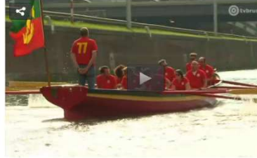
'We hopen volgend jaar twee extra boten te hebben. Dan is de bemanning ineens ook meer dan verdubbeld.'

Eén jaar geleden koos de roei- en zeilboot Zinneke voor het eerst het ruime sop. De boot werd op acht maanden gebouwd door enkele mensen van de Brussels Yacht Club en sneed tijdens zijn eerste levensjaar al door verschillende internationale wateren. Dit weekend roeide de tienkoppige ploeg weer door het vertrouwde kanaalwater voor een eerste eigen regatta: de Zinneke Trophy.