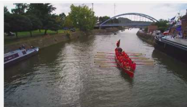
Grand Pardon des bateaux