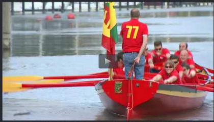
Il y a un an la Yole de Bantry « Zinneke » faisait son baptême de l'eau sur le canal de Bruxelles. Un an et quelques courses plus tard, l'embarcation aux couleurs belges envahit quelques Yoles amies de l'hexagone pour la toute première régata dénommée « Zinneke Trophy ». Une manière de mettre en évidence l'intérêt grandissant de la voile et de l'éviron sur le canal. « Zinneke » a tenu le 2e du classement général des dérivés.